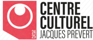
Centre Culturel Jacques Prévert de Villeparisis