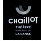
Chaillot théâtre national de la danse